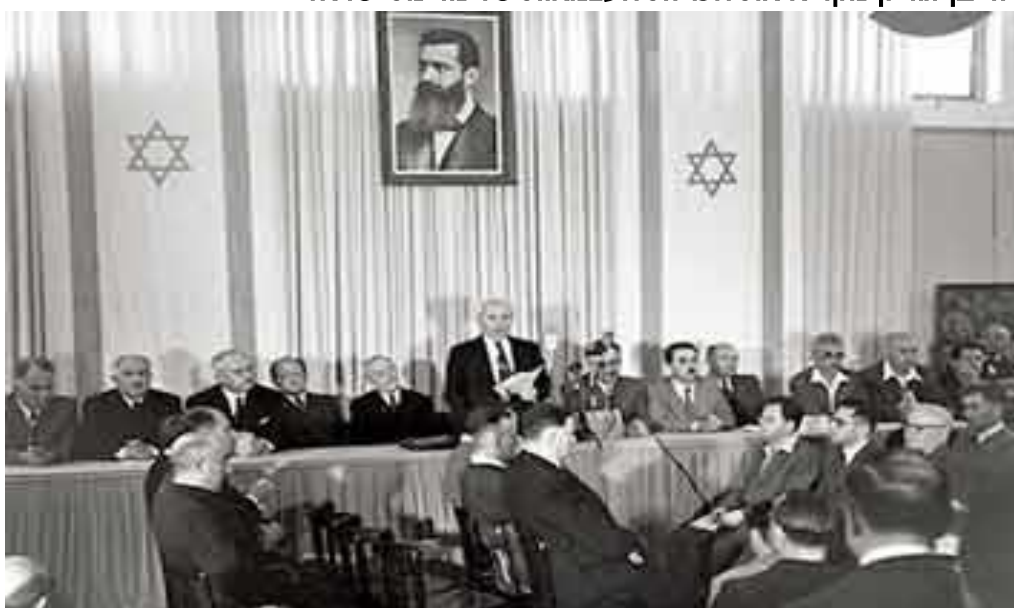
דוד בן-גוריון מקריא את הכרזת העצמאות של מדינת ישראל

מגילת העצמאות היא מסמך שקרא דוד בן גוריון בטקס הכרזת העצמאות של מדינת ישראל. הטקס התרחש בעיצומה של מלחמה העצמאות במוזיאון תל אביב הישן (שדרות רוטשילד 16) ביום שישי, ה' באייר תש"ח, 14 במאי 1948, בשעה 16:00, 8 שעות לפני סיום המנדט הבריטי בארץ ישראל. מגילת העצמאות הוא אמנם שמה המקובל, אבל שמה הרשמי הוא "הכרזה על הקמת מדינת ישראל", ובשם זה התפרסמה בעיתונים.